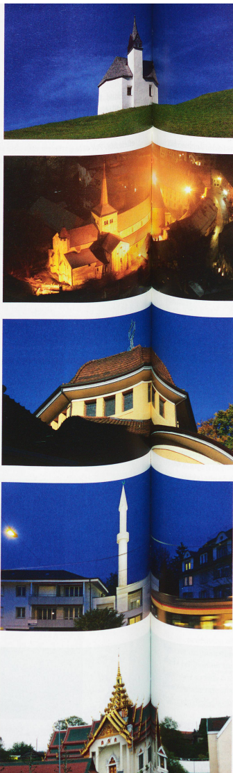
Templos en Suiza:

En la actual situación de cambios radicales, las grandes iglesias adoptan a menudo una posición defensiva. Por este motivo, unos les reprochan estar anticuadas, otros que su decreciente influencia se debe a haber «aguado» su tradición y su mensaje adaptándose demasiado a los nuevos tiempos. En su estudio, el sociólogo religioso de Lausana Jörg Stolz y su colega Edmée Ballif ponen de manifiesto que para la evolución no es tan decisivo el