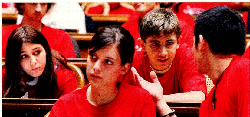
Jóvenes en la sala del Consejo Nacional, en Berna, durante la sesión parlamentaria juvenil