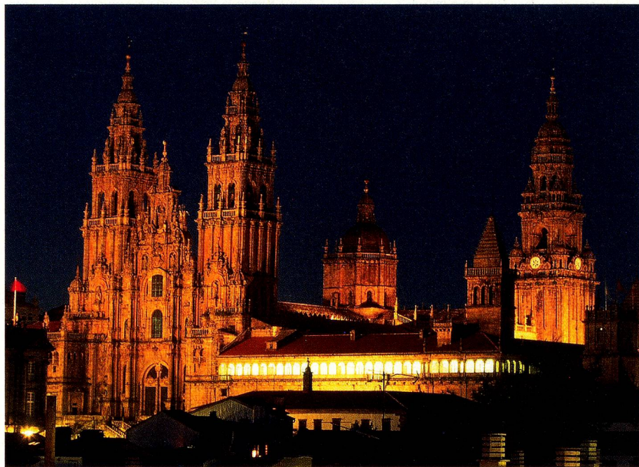
La catedral de Santiago de Compostela

ruta cada año. Después se calmaron las cosas durante algunos siglos. El impulso para el relanzamiento se debe a Elías Valiña, párroco del pueblecito gallego de O Cebreiro, en 1982, que tras la visita del Papa Juan Pablo II a Santiago de Compostela, en la que recordó a los católicos la ancestral tradición del Camino de Santiago, empezó a marcar con postes amarillos el Camino Francés entre los Pirineos y Santiago de Compostela, y abrió un albergue de peregrinos junto a su iglesia. La publicidad funcionó de maravilla, y parece que era el momento propicio para nuevas avalanchas de peregrinos. Ya en 1993, la UNESCO declaró el Camino Francés Patrimonio Cultural de la Humanidad.