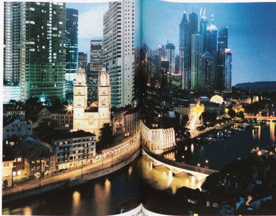
Panorama previsto por los críticos de la inmigración para la comarca de Eibach.

El porcentaje de extranjeros residentes en Suiza es relativamente elevado desde hace mucho tiempo. Ya en 1910, la proporción de extranjeros con residencia permanente era del 15%. Esta cifra volvió a alcanzarse en 1980 tras un retroceso durante las dos guerras mundiales. El elevado porcentaje de extranjeros es, en parte, consecuencia de la restrictiva política de naturalización que rige en Suiza.