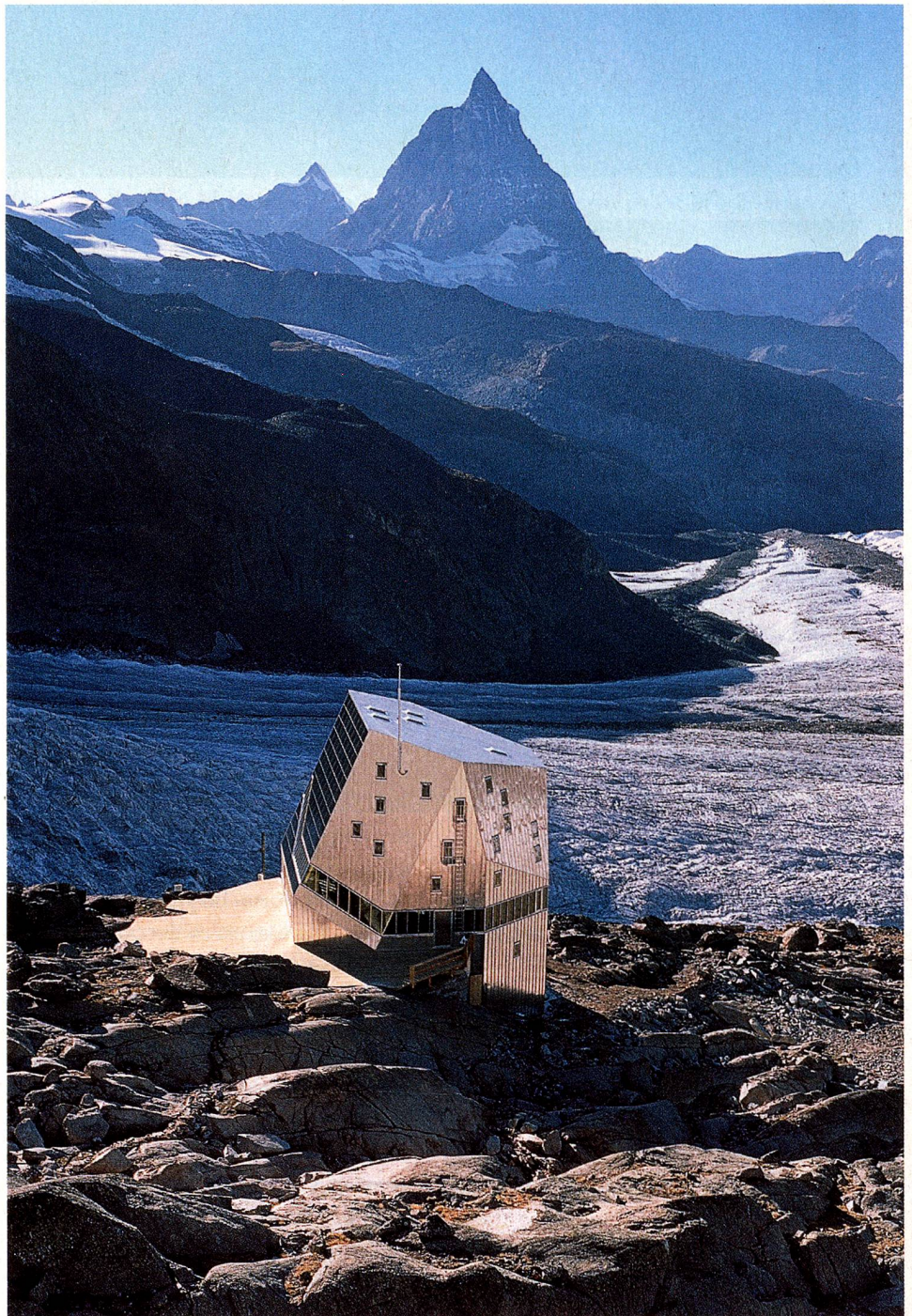
El Comité Central del CAS en 1893, la cabaña Monte-Rosa, inaugurada en 2009, la cabaña Dom con el Weisshorn, en torno al año 1900, y la cabaña Krönten, en la región del Gotardo

A mediados del siglo XIX, la montaña y la alta montaña aún guardaban innumerables enigmas. También fue la era dorada del alpinismo (1855-1865), que vería coronadas las más altas cumbres europeas y helvéticas, generalmente por estrellas británicas. Nace un fuerte impulso patriótico y científico capitaneado por el geólogo Rudolf Theodor Simler, que temía que los suizos desearan de informarse sobre los Alpes tendrían que recabar información en publicaciones inglesas. «Una situación semejante nos resultaría penosa, vergonzosa». En este contexto, el Club Alpino Suizo fue fundado el 19 de abril de 1863 en la cantina