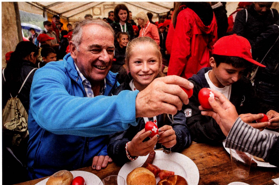
Adolf Ogi con niños de Europa del Este, que gracias a la fundación Swisscor reciben asistencia médica

A veces hay que observar las cosas desde una prudente distancia. Por ejemplo: en el verano de 1992, la nave espacial Atlantis de la NASA giró a toda velocidad 127 veces alrededor del globo terrestre – y a bordo iba Claude Nicollier, el primer y hasta hoy único astronauta suizo. Fue un gran paso para Nicollier y uno gigantesco para la astronáutica suiza. A 30.000 km por hora, ese vehículo espacial se desplazó por el firmamento a toda velocidad alrededor de la Tierra. Pero lo que hizo concretamente Nicollier en el helador espacio no ha dejado huellas en la memoria colectiva de Suiza. Sin embargo se ha quedado grabado lo que el consejero federal Adolf Ogi transmitió el 7 de agosto de 1992 a Nicollier a través de un complejo radioenlace lanzado al éter: «¡Reina el entusiasmo, Monsieur Nicollier!» La felicitación se convirtió inmediatamente en una contraseña. Citada miles de veces, se ha incorporado al vocabulario del suizo alemán: el entusiasmo es especialmente grande cuando no sólo es perceptible sino que los determina todo, cuando «reina el entusiasmo».