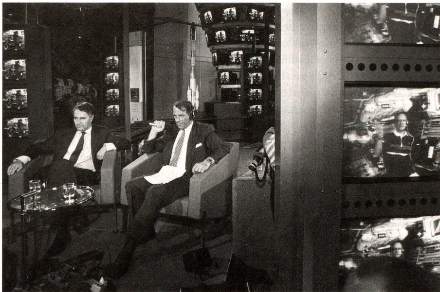
Ogi durante la transmisión en directo con Claude Nicollier en la nave espacial Atlantis, en agosto de 1992

Swisscor es el legado social de Ogi procedente de su época en el Consejo Federal. La fundación creada asimismo por él «Freude herrscht» aúna aspectos sociales y deportivos: esta institución quiere fomentar el deporte y el ejercicio entre los niños. Haciendo que en sus proyectos y sus actividades los jóvenes sean el centro de atención, intenta consolarse del fallecimiento de su hijo: «No vamos a lograr un mundo mejor de la noche a la mañana. Pero podemos mejorarlo si nos concentramos en los jóvenes». Ogi, en su día muy comprometido con el deporte de élite y artífice de los