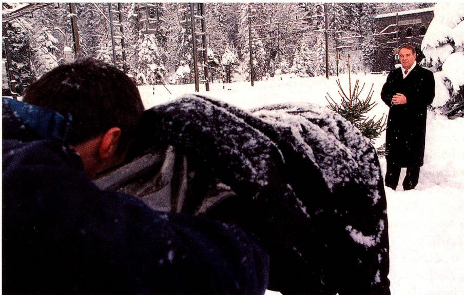
Discurso de Año Nuevo frente al túnel del Lötschberg en Kandersteg, en 1999