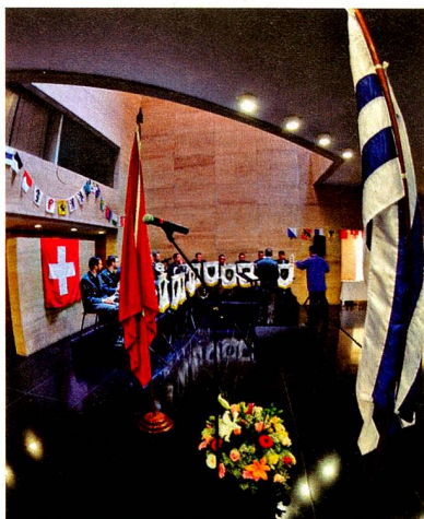
Banda Militar Suiza en el Auditorio Nacional.