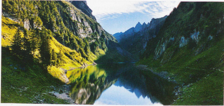
Lago de Fählen en el cantón de Appenzel Rodas Interiores, con la cumbre Altmann al fondo