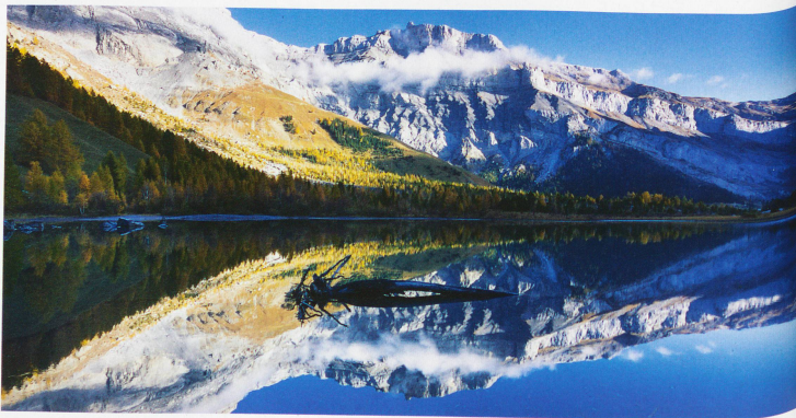
Lago de Derborence en el cantón del Valais, con la punta rocosa Tour Saint-Martin, también llamada Quille du Diable (cono del diablo)