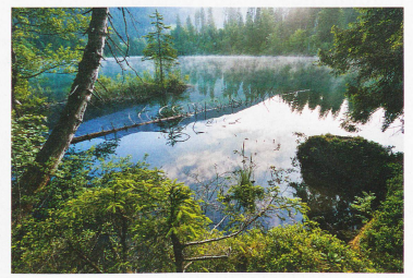
Lago de Cresta en Flims, cantón de los Grisones