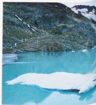
Glaciar Gaull, en el cantón de Berna, y el lago de Fählen al fondo, al amanecer