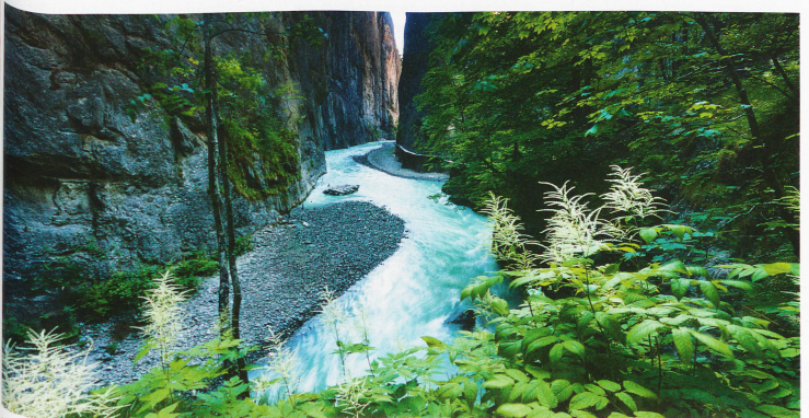
Desfiladero del Aare entre Meiringen e Innertkirchen, en el cantón de Berna