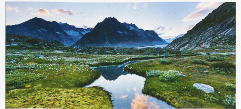
El afluente del lago Märjelen, al extremo del gran glaciar del Aletsch, en el cantón del Valais