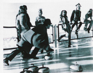
James Bond practicando el curling, 1968