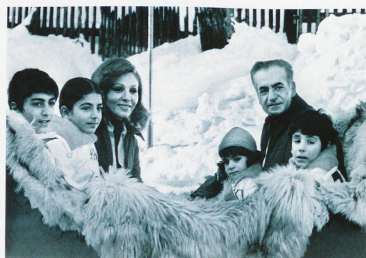
El Sha de Persia con su familia en St. Moritz, 1975