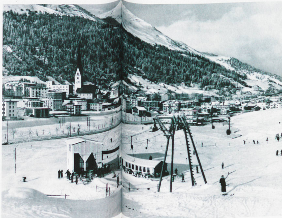
El remonte de Bolgen, en Davos, fue el primer telesquí del mundo, foto del invierno de 1934-1935