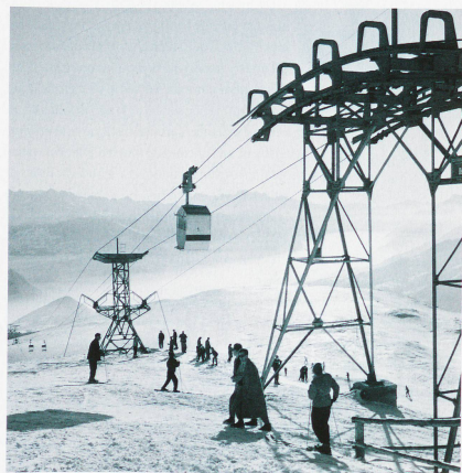
Primer teleférico de Suiza en Crans-Montana, 1950