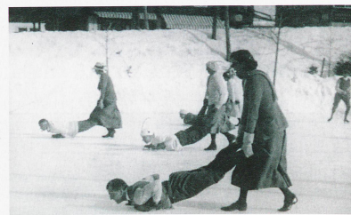
Juegos de hielo (Gymkhanas) en Grindelwald