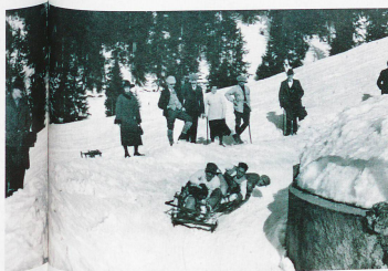
Salvaje carrera de trineos en Crans-Montana