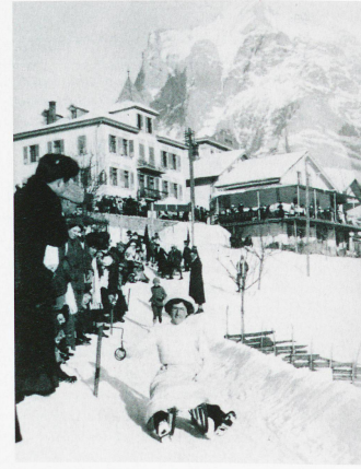
Carrera de trineos Village Run en Grindelwald