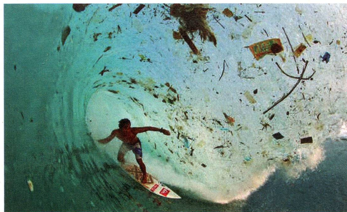
Isla de Java, Indonesia

es el capitán del navío y está también totalmente abocado a la causa. Los equipos se reunirán con las poblaciones locales para recabar información sobre sus propuestas de soluciones para mitigar la contaminación de plástico en sus costas. Navegantes, pescadores, autoridades, ONGs locales y testimonios de todos los actores locales, serán considerados.