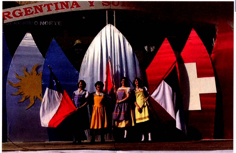
La delegación de Chile en el escenario principal

La Fiesta Nacional del Folclore Suizo se realiza anualmente, en el mes de junio y este año ha tenido una connotación especial ya que se enmarcó en el Bicentenario del ingreso del Cantón de Valais a la Confederación Helvética. Año jubilar para Suiza ya que tres cantones festejan en 2015 el ingreso a la CH de Ginebra, Neuchâtel y Valais. Además se concretó el "Hermanamiento" entre las Comunas de Brig-Glis (Wallis/Suiza) -origen de las familias que fundaron la colonia en el año 1858- y la Comuna de San Jerónimo Norte, coincidiendo también con la celebración de los 800 años de la fundación de la ciudad de Brig/Wallis.