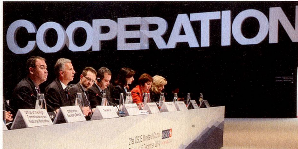
Sala del Consejo Ministerial, mesa principal

Para más información sobre la presidencia suiza de la OSCE en 2014, véase el dossier web: https://www.eda.admin.ch/eda/de/home/aktuell/dossiers/osze-vorsitz-2014.html