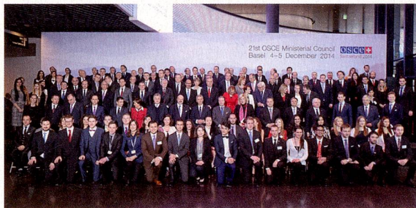
Foto de grupo