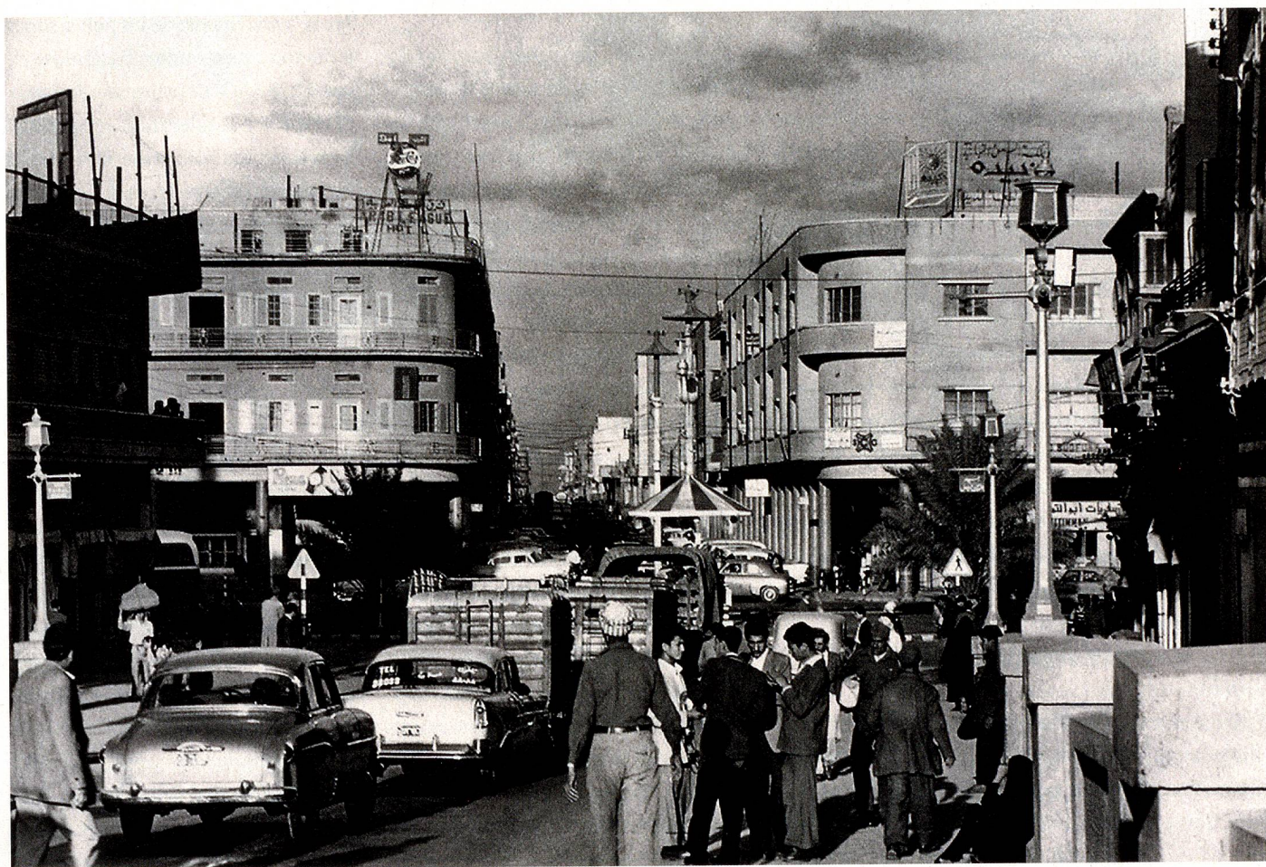
La Rashid Street en Bagdad, en 1956