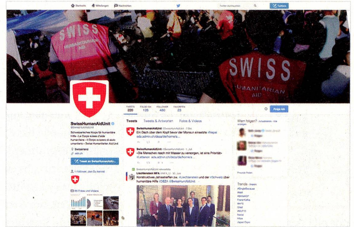
Perfil en twitter del Cuerpo Suizo de Ayuda Humanitaria.