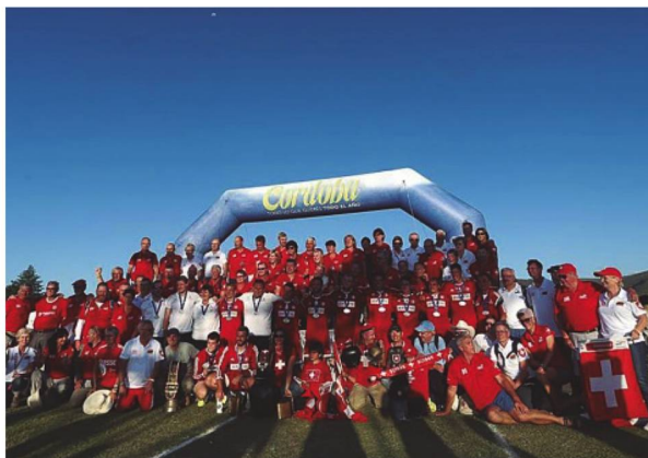
Suiza: medalla de plata