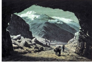
Panorama Suizo / Agosto de 2016 / NP4

Una ilustración romántica del Urnerloch, el primer túnel carretero de los Alpes.