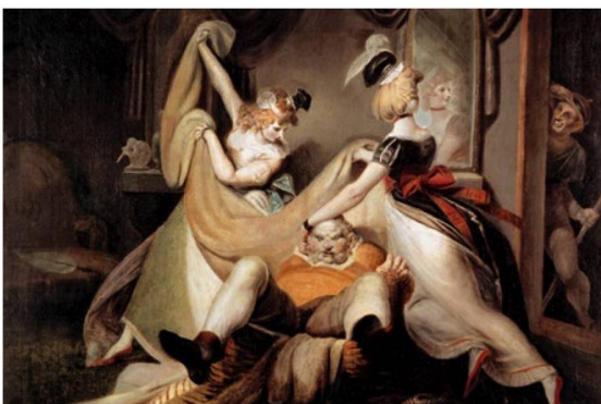
Heinrich Füssli: "Falstaff im Wäschekorb" (Falstaff en el cesto de la ropa) (1792).