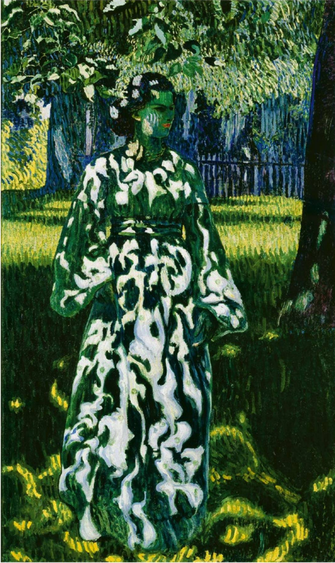
Cuno Amiet: "Sonnenflecken" (Manchas solares) (1904).