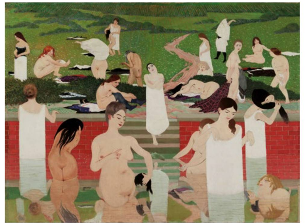
Félix Vallotton: "Das Bad am Sommerabend" (Baño en una tarde de verano) (1892).