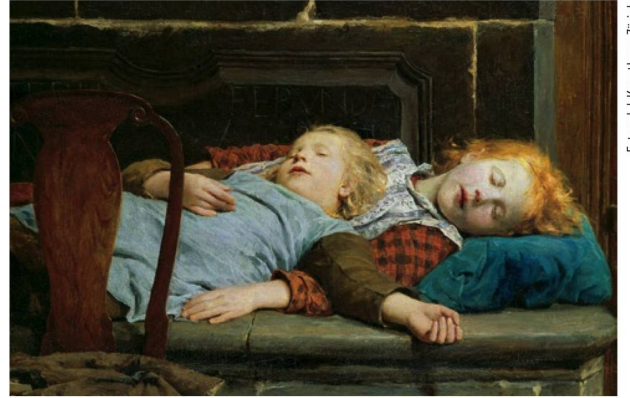
Albert Anker: "Zwei schlafende Mädchen auf der Ofenbank" (Dos muchachas dormidas en la banqueta de la estufa) (1895).