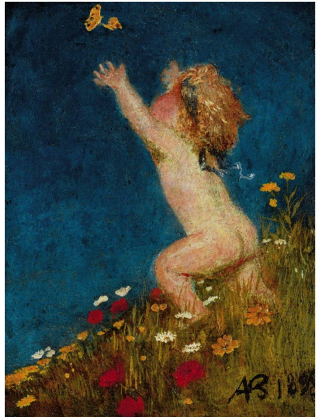
Arnold Böcklin: "Putto und Schmetterling" (Putto y mariposa) (1895).