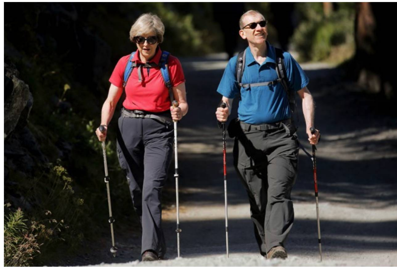
¿Un buen presagio? La Primera Ministra británica, Theresa May, pasó sus vacaciones de verano con su marido, Philip, en Zermatt.

cual la iniciativa se aplicará, por una parte, asegurando una leve ventaja a la población nacional. Conforme a esta propuesta del PLR, los empresarios tendrán que anunciar primero sus vacantes a los centros regionales de colocación en Suiza, antes de reclutar solicitantes en el extranjero. Por otra parte, según esta propuesta se aplicará una cláusula de salvaguardia regional y sectorial, de acuerdo con el modelo