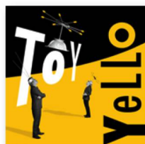
YELLO: «Toy», Universal Music.

Seamos sinceros: nadie esperaba que Yello se atreviera a introducir cambios radicales en su 13.º álbum. Dieter Meier y Boris Blank se mueven desde finales de los años 70 en su propio cosmos musical; desde hace mucho tiempo ya han desarrollado un sonido que ha influido a generaciones de músicos electrónicos y es mucho más que una simple marca o un simple sello. Combinado con su extravagante lenguaje visual, constituye una