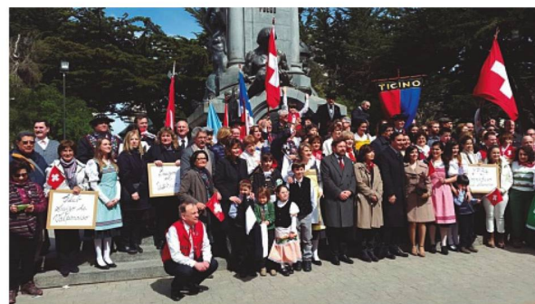
Autoridades y participantes del desfile en la Plaza Muñoz Gamero

Finalizado el desfile todos los participantes se convocaron en el monumento de la Plaza Muñoz Gamero para