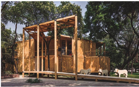
Casa de Suiza México 2016 en el Bosque de Chapultepec