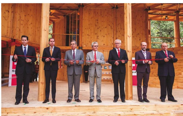
Los CEOs de las empresas patrocinadoras inauguran la Casa de Suiza México 2016

concluyó que “...además de ser el octavo inversionista directo más importante en México, Suiza es un socio privilegiado en materia de negocios y política multilateral. La Casa de Suiza México 2016 fue el foro ideal para una mayor profundización de la cooperación entre ambos países”.