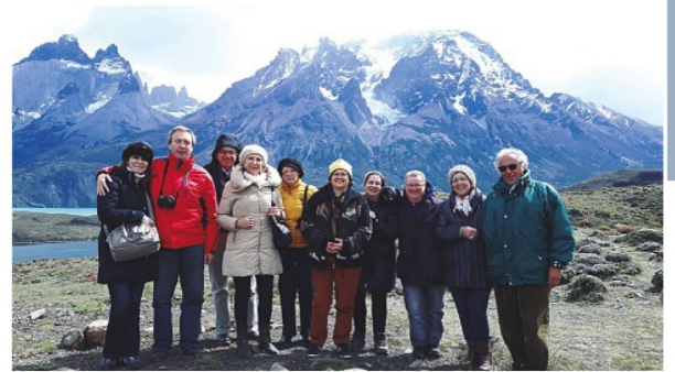
Visita al Parque Nacional Torres del Paine

. Fuerte presencia, apoyo y promoción de los clubes suizos por parte de las Embajadas tanto en Chile como en Argentina.