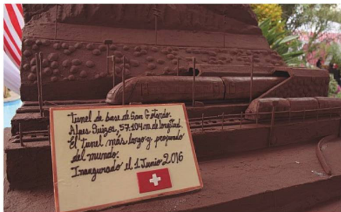
Túnel San Gotardo en chocolate

El 5 de octubre se presentó la obra Zick-Zack-