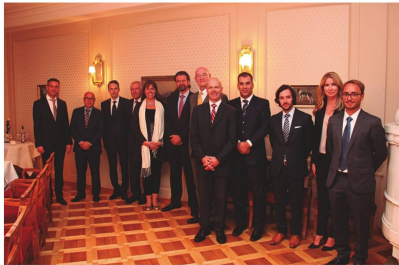
La Alcaldesa de Nueva Helvecia en Suiza, junto al Embajador de Uruguay en Suiza, descendientes de fundadores Meyer y empresarios suizos