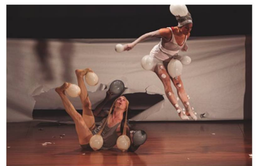
Zick-Zack-Puff en acción

(ESTHER-MARIE MERZ- AGREGADA CULTURAL Y DE PRENSA DE LA EMBAJADA DE SUIZA EN LIMA/PERÚ)