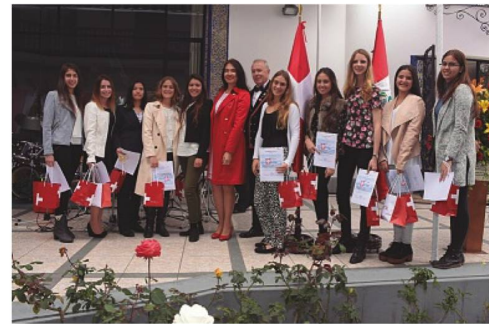
Jóvenes ciudadanas con el Sr. Embajador y su esposa

Puff, de la Compañía Suiza de Danza Mafalda. Maravillaron a los 600 estudiantes cuando se presentaron en el Colegio Alemán Alexander von Humboldt. Asistieron también alumnos del Colegio Suizo Pestalozzi y de un Colegio de la Tablada de Lurín.