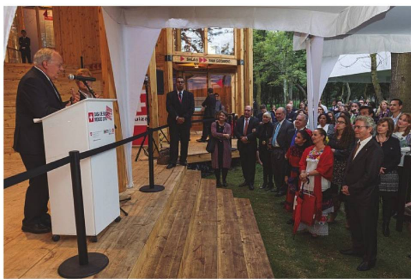
El Presidente Johann Schneider-Ammann en la Casa de Suiza dirigiendo sus palabras a la comunidad suiza.