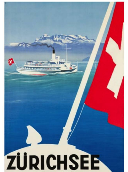
"Lago de Zúrich", 1935.