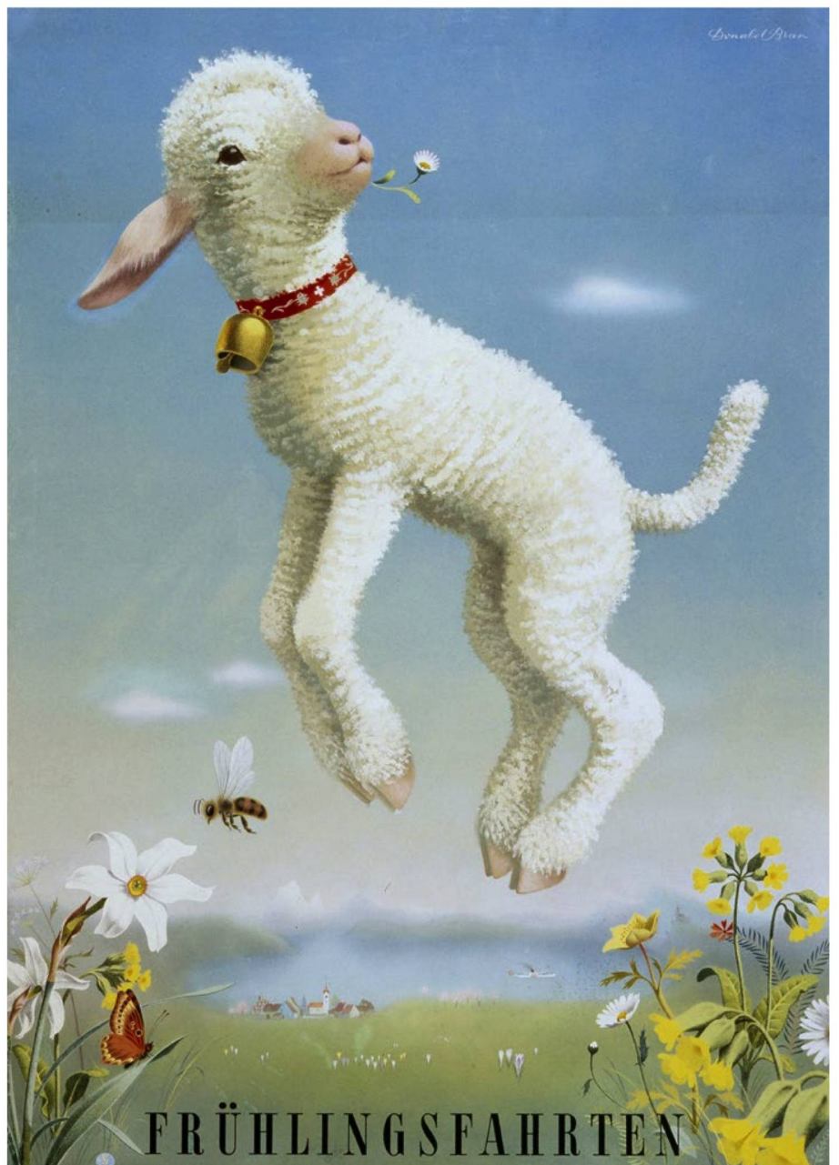
"Excursiones de primavera", 1945.