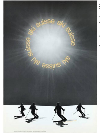
"Esquiando en Suiza", 1971.