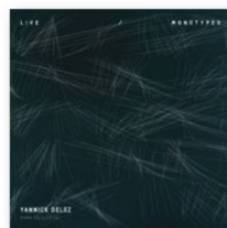
YANNICK DELEZ: "Live/Monotypes", Unit Records, 2017.

Yannick Delez es un pianista que toca música moderna inspirada en el jazz, pero que cautiva también a los amantes de la música clásica y la improvisación. Este artista de 44 años nacido en Martigny (Suiza occidental) pero que vive desde 2011 en Berlín, sorprende con un nuevo álbum doble en el que toca solo: "Live/Monotypes" es una obra llena de energía que cautiva una y otra vez.