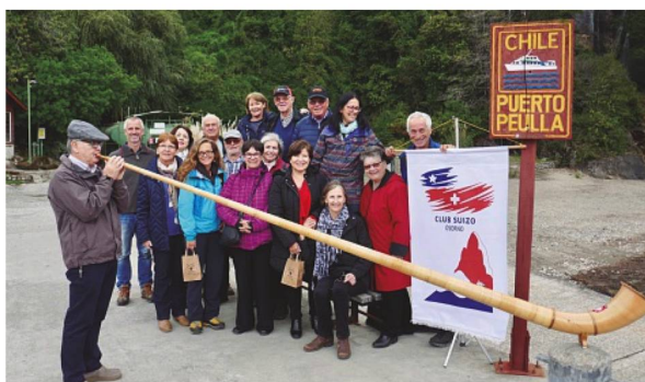
Integrantes del Club Suizo de Osorno