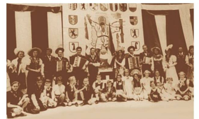
1- Fiesta Suiza 1º de agosto 1920 2- Día de campo en el Desierto de los leones-Julio 1922 3- 1º de agosto 1947