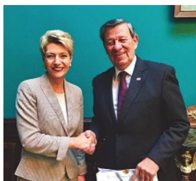
Senadora Karin Keller-Sutter y Cancellor Uruguayo Rodolfo Nin Novoa

Si tiene problemas para acceder o si tiene preguntas sobre la ventanilla en línea del DFAE, dirijase por favor al Centro Consular Regional Buenos Aires.