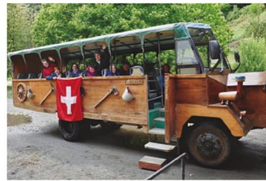
Recorrido del valle del río Peulla

El grupo caminó hacia una gran cascada y al día siguiente recorrimos parte del valle del río Peulla, en un camión transformado en bus. Todos fuimos capturados por la exquisita miel que otro suizo produce con la gran variedad de flores nativas del bosque, parte de un Parque Nacional. No fue po-