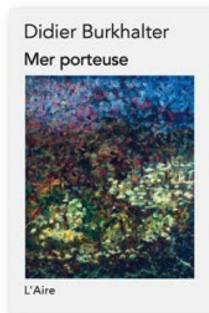
DIDIER BURKHALTER: "Mer porteuse". Éditions de L'Aire, 2018, 194 págs., CHF 24.-, Euro 24.-

Mer porteuse , tercera obra de Didier Burkhalter, surgió junto al lago de Neuchâtel; su prosa poética nos cuestiona sobre la ascendencia y la fuerza de nuestras raíces familiares. El personaje central de esta historia de un niño abandonado es el Atlántico, símbolo de separación, pero también de unión entre las personas. El libro del ex Consejero Federal es de estilo agradable, como en ese fragmento donde los penachos de humo de un transatlántico conectan el buque con el cielo, "como si temiese ser tragado por las profundidades". ¿Sus puntos débiles? Una cierta pesadez o ampulosidad en la formulación, en virtud de la cual la indiferencia no puede ser sino "sobrecogedora" y, obviamente, será un "océano de desesperanza" el que termine sumergiendo a uno de los personajes de la novela.