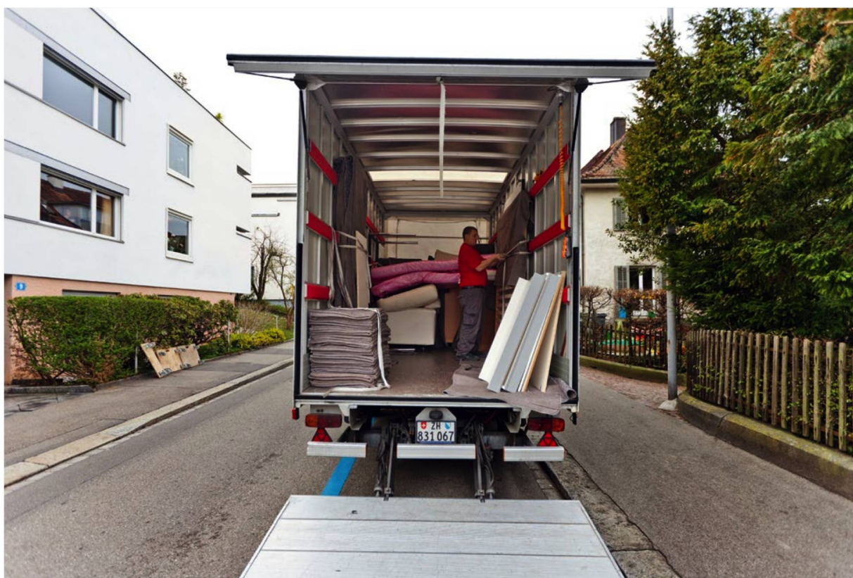
Las mudanzas de un apartamento de alquiler a otro forman parte de la vida cotidiana en Suiza.

Posición contraria (en alemán): ogy.de/hev-kritik