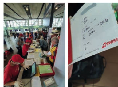
Antes del vuelo, Aeropuerto Arturo Merino Benítez