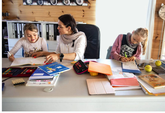
Todos las escuelas permanecieron cerradas (Colaten, BE). Los niños y los padres tuvieron que hacer frente a la doble exigencia de estudiar y trabajar en línea. Y para los jóvenes a punto de iniciar sus estudios universitarios o su formación profesional, este tiempo de confinamiento supuso todo un desafío.