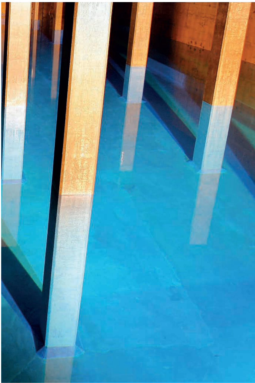
Un templo acuático subterráneo: el depósito de agua potable de Lyren, en Zúrich-Altstetten.

freático; el 20 por ciento restante, de los lagos. El mayor volumen de aguas subterráneas se encuentra bajo la superficie de los valles y de las fértiles planicies de la meseta suiza, donde se cultivan hortalizas y cereales. En estas tierras agrícolas de explotación intensiva, desde hace décadas se usan pesticidas que son objeto de controversia. El ejemplo más reciente es el fungicida clorotalonil, ingrediente activo de algunos productos fitosanitarios que, desde los años setenta, se pulverizan sobre las tierras de cultivo para combatir los hongos.