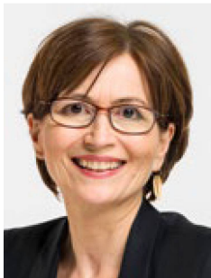
Para la Consejera Nacional Regula Rytz, se trata de “un intento de acallar a la ciencia portadora de malas noticias”.