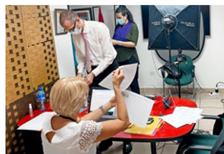
Un servicio muy apreciado en esos tiempos de restricciones para viajar: la unidad móvil de pasaportes, aquí en su tránsito por Panamá. Foto puesta a disposición de la revista

El siguiente evento se llevará a cabo en forma híbrida: seis compañeros a cargo de los servicios consulares en nuestras seis representaciones de Centroamérica, se reunirán físicamente en Costa Rica para conversar con