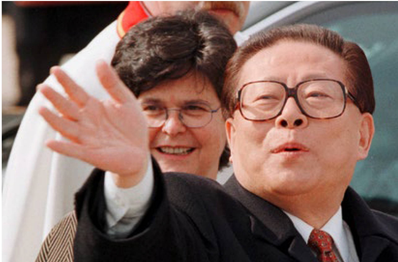
Hasta ese momento marchaba sobre ruedas: el jefe de Estado chino, Juang Zemin, junto a la Presidenta de la Confederación, Ruth Dreifuss, a su llegada al aeropuerto de Ginebra en 1999.