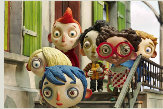
“La vida de Calabacín” ganó el premio a la mejor película de ficción en los Swiss Film Awards de 2017 y fue nominada como mejor película animada en los Óscars.

La fundación suiza para la cultura Pro Helvetia promueve la divulgación de obras y proyectos de artistas suizos en el extranjero mediante su apoyo a eventos, proyectos y traducciones. Esto incluye la financiación de presentaciones públicas, la realización de eventos promocionales para organizadores internacionales, la participación en ferias especializadas y eventos de networking, el apoyo a la presencia de Suiza (por ejemplo, en la Bienal de Venecia o en el Festival de Teatro de Aviñón), así como la facilitación de material de promoción. Sus seis oficinas de enlace en El Cairo, Johannesburgo, Moscú, Nueva Delhi, Shanghái y Sudamérica mantienen contactos con instituciones culturales y socios locales, actúan como intermediarias en estas regiones y ofrecen programas de residencia, investigación e intercambio que ayudan a los creadores suizos de arte y cultura a establecerse y tejer una red internacional de contactos.