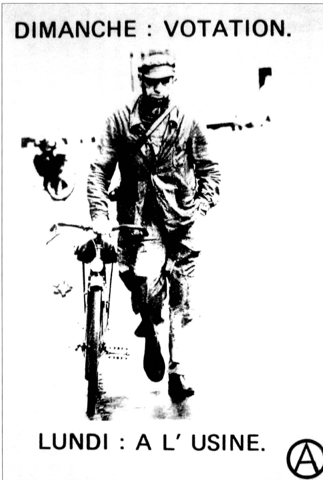
Affiche d'anarchistes genevois, 1976. Centre international de recherches sur l'anarchisme, Lausanne.