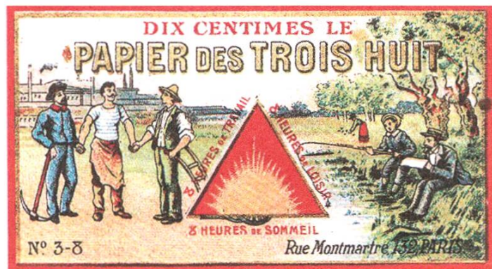
Ill. tirée de Maurice Agulhon, La République: de Jules Ferry à François Mitterrand , Paris, 1990.