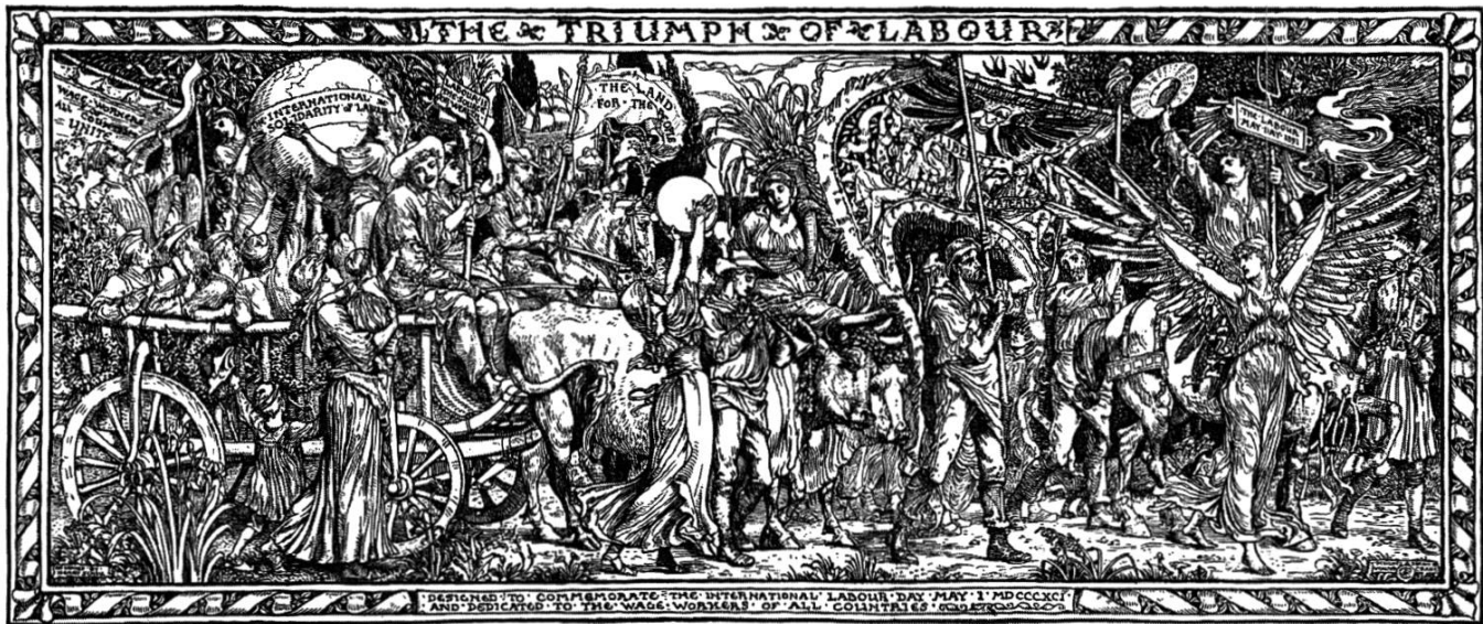
Walter Crane, The Triumph of Labour , 1891

lutte ouvrière, et une fête syndicale et familiale qui ne commémore rien mais annonce les temps nouveaux 3 .