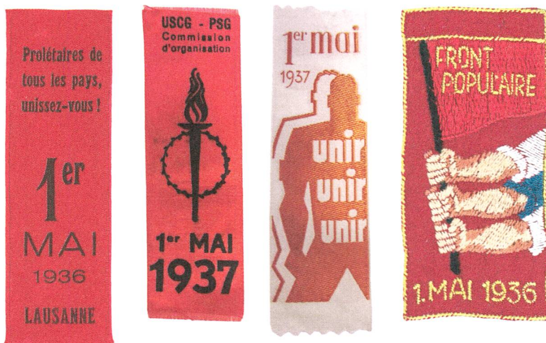
Archives d'État de Genève. Musée historique, Lausanne.

été dessinés de la main gauche, ou des deux versions du ruban socialiste de 1941. Par ailleurs, un seul ruban portant l'image de la faucille et du marteau apparaît en 1921.