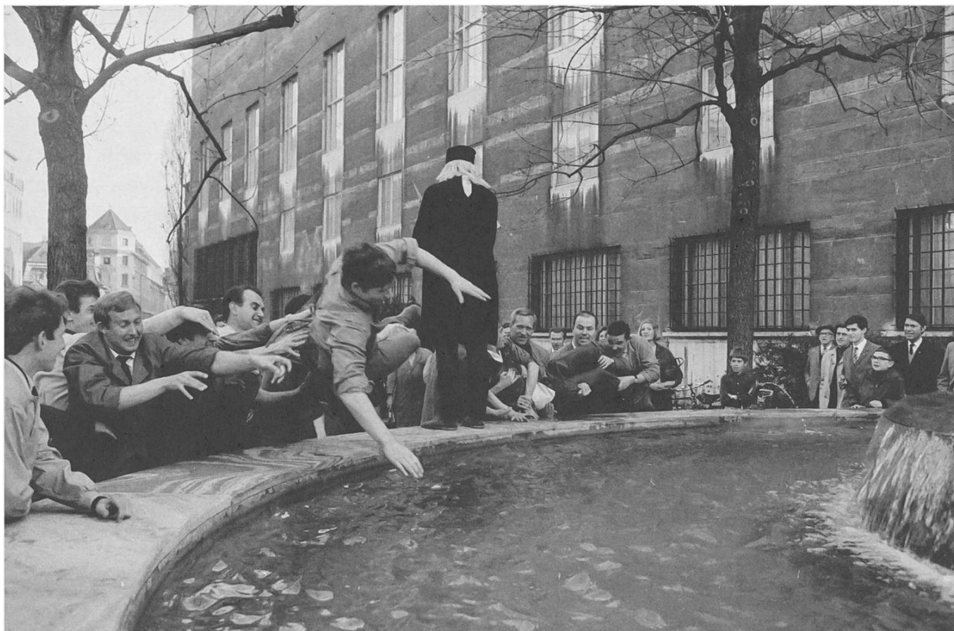
Baptême typographique dans un lieu indéterminé, avril 1968.

un sentiment de vide, de vieillissement. En effet, c'est d'elle, résolue, virile, que se dégageront la cohésion et la force de la fédération.» 16