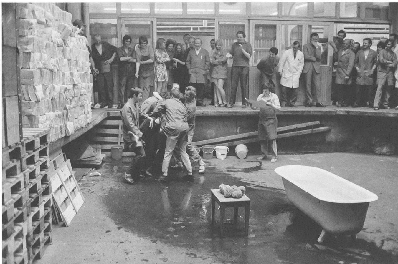
Baptême typographique à l'imprimerie de la Neue Zürcher Zeitung à Zurich, mai 1973.