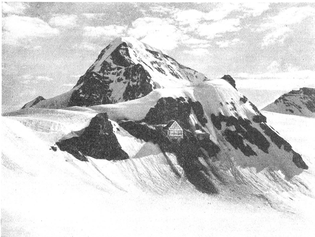
Fig. 1. Berghaus Jungfraujoch, 3457 m über Meer, mit Mönch.

Obschon zur Zeit des Wegganges von Bergführer Steuri eine Besserung und Aufhellung des sehr schlechten Wetters eingetreten war, konnte der drei Stunden lange Rückweg zum Jungfraujoch weder am gleichen noch am folgenden Tag bewerkstelligt wer-