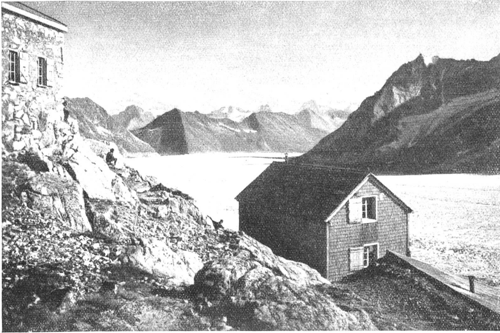
Fig. 2. Pavillon Cathrein und Konkordiahütte.