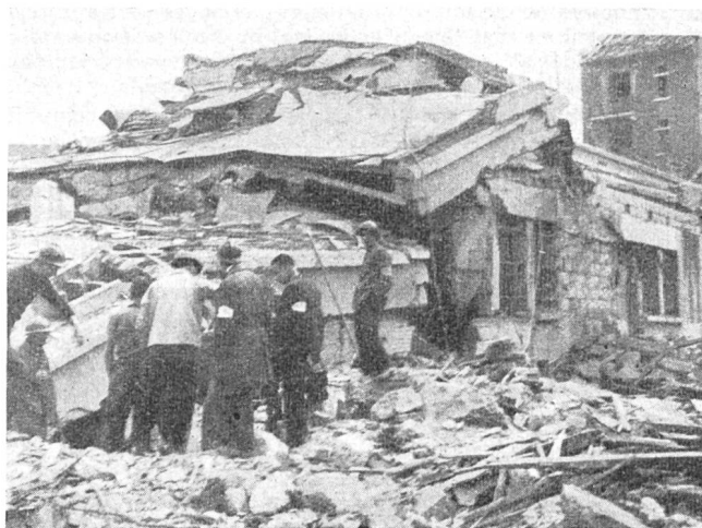
Fig. 1. Etat de la station de répéteurs d'Annecy après le bombardement du 10 mai 1944

Le rétablissement d'autres circuits à grande distance est attendu au cours des prochains mois, notamment avec la Belgique, les Pays-Bas, la Hongrie, la Tchécoslovaquie, la Yougoslavie et même avec la Pologne.