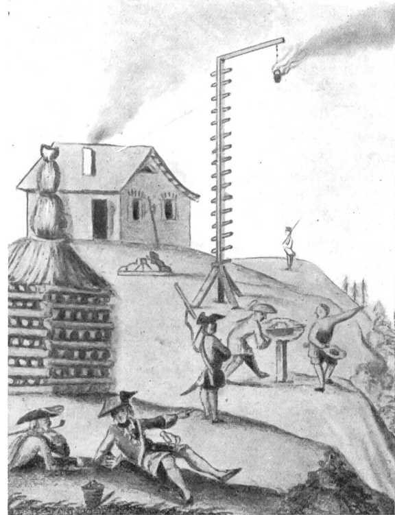
Hochwacht in St-Triphon (Vd)

ordnung der Landgerichte», mit einem Verzeichnis der Hochwachten des Kantons Bern vom Jahre 1734. Dieser hatte insgesamt 156 Hochwachten, die den ganzen Kanton umfaßten und durchquerten und an allen Grenzen in Verbindung mit den Hochwachten der übrigen Kantone standen. Lüthy hat in seiner Arbeit über die bernischen Chuzen die «Generaltabelle aller Wachtfeuren in Ihr Gnaden Teutsch und Weltschen Landen» vom Jahre 1734 veröffentlicht. Auf Grund dieser Tabelle kann das bernische Hochwachtennetz rekonstruiert werden. Zur bessern Veranschaulichung wäre bloß das Ein-