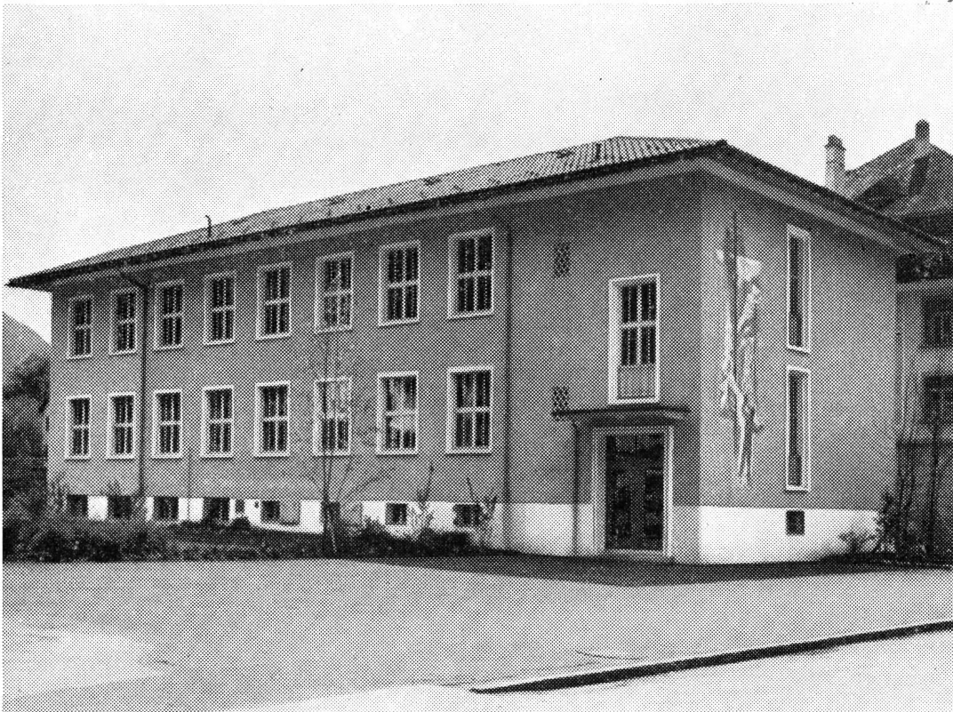
Fig. 2. Telephongebäude Altdorf

auch in den Altdorf umliegenden Netzen den Einbau grösserer Zentraleneinrichtungen. Da in der Zwischenzeit in der Schweiz die automatische Telephonie verschiedener Systeme (Bell, Hasler, Siemens) Eingang gefunden hatte, wurden auch im Kanton Uri Zentralen dieser Art in Betrieb genommen. Die nachfolgende Zusammenstellung zeigt die Entwicklung in bezug auf die Betriebsarten (Lokalbatterie- (LB-) System, Zentralbatterie- (ZB-) System, Automatik):