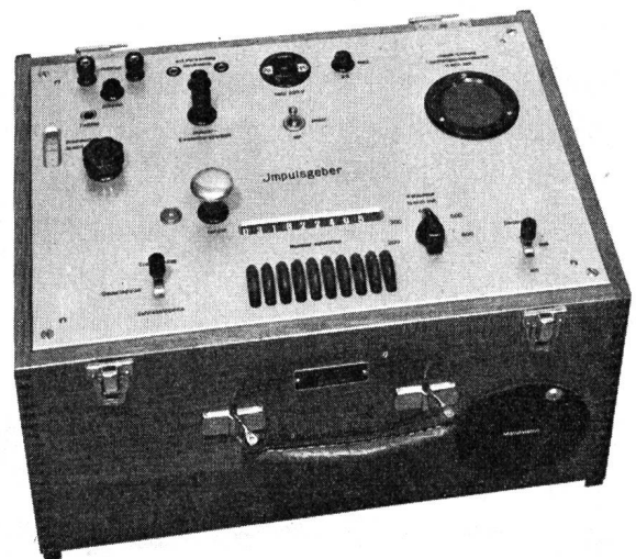
Fig. 2. Zahlengeber — Emetteur de chiffres

S'il s'agit d'envoyer le numéro composé, on doit avant tout introduire la fiche d'un appareil téléphonique dans le jack désigné par «Telephon». Quand on décroche le récepteur, on entend le signal du central et l'on peut transmettre le numéro. On déclenche l'émission en pressant sur le bouton désigné par «Senden». La sélection terminée, on peut parler avec l'abonné appelé. Lorsqu'on raccroche le récepteur, la communication est de nouveau coupée. En décro-