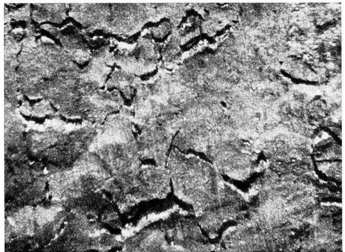
Fig. 2. Leicht gebogene Oberfläche einer Bleiprobe, die 6 Monate in 0,005molarer Bleiazetatlösung lag. Beim Biegen wurde die Oberfläche etwas gedehnt, so dass die sehr feinen, interkristallinen Risse aufsprangen und gut sichtbar wurden. Vergrößerung: 25 ×

Ces résultats montrent que, d'une part, toute solution de sel de plomb ne provoque pas nécessairement une corrosion intercrystalline mais que, d'autre part, l'acétate de plomb tout au moins agit de façon analogue au nitrate de plomb. De plus, il vaut la peine de relever que les solutions pures provoquent déjà la corrosion intercrystalline du plomb sans addition d'acide.