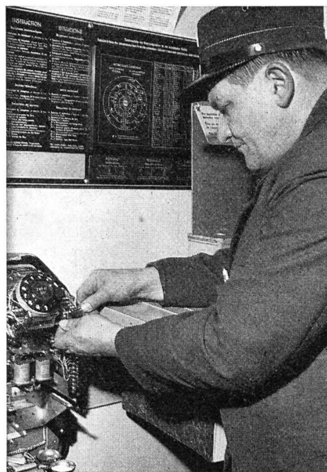
Fig. 2. Ergänzen der Zahlenrollen der Kassierstation durch die Zahl 80

Les postes à prépaiement, dont 10 000 sont actuellement en service en Suisse, présentent des difficultés particulières lors de tout changement de taxation. En plus des considérations purement techniques pour les adaptations des organes d'encaissement, il faut aussi tenir compte du comportement du public. D'une part, l'usager d'un poste à prépaiement doit être rendu attentif aux modifications des taxes, pour qu'il introduise le montant correct; d'autre part, il est nécessaire de prendre des précautions pour éviter d'importants dérangements lorsque le public fait des manipulations incorrectes. Pour satisfaire à toutes ces conditions, nous avons pris les mesures suivantes: