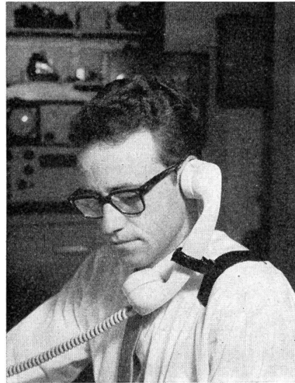
Fig. 1. Position incorrecte du microtéléphone Posizione scorretta del microtelefono

Un caso interessante a proposito di supporti per microtelefoni è quello di un commerciante che presentò anni or sono un ricorso di diritto amministrativo al Tribunale federale, contro il rifiuto di accordargli un'autorizzazione. Egli pretendeva che per poter utilizzare il suo dispositivo di fissazione non occorreva nemmeno un'autorizzazione!