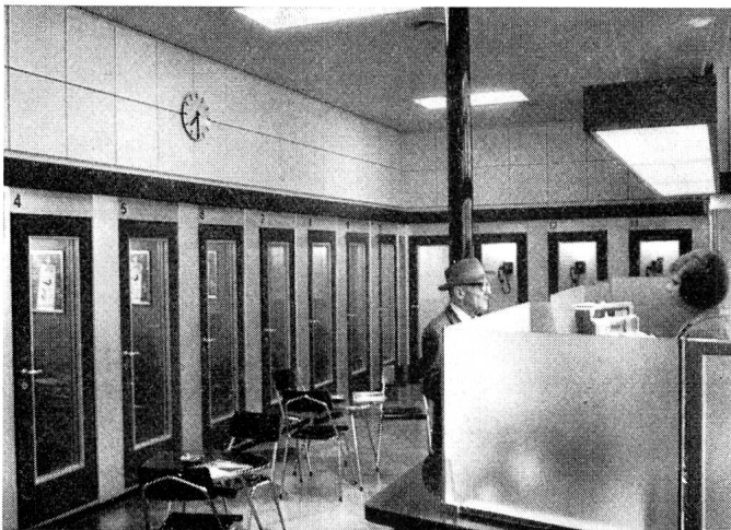
Fig. 2. Telegraphenschalter mit Telephonkabinen und öffentlicher Telexstation

amt I montiert werden, das 10000 Teilnehmerausrüstungen nach dem Motorwählsystem Albiswerk Zürich AG erhalten und das aus dem Jahre 1930 stammende alte Amt ersetzen wird. Im dritten Stock, wo sich zur Zeit unter anderem der Hauptverteiler befindet, werden 1963/64 neu das manuelle Fernamt mit im Endausbau 48 Arbeitsplätzen, das erweiterte Fernamt für vorerst 400 von 1500 geplanten 4-Draht-Leitungsausrüstungen nach dem