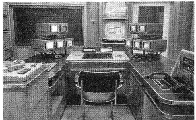
Fig. 3. Bedienungsplatz des Tonsternpunktes

Es sei hier noch auf den Zusammenhang und auf die Aufgabenverteilung zwischen Sendestudios, Endkontrollen, Schaltstellen und Sendern eingegangen.