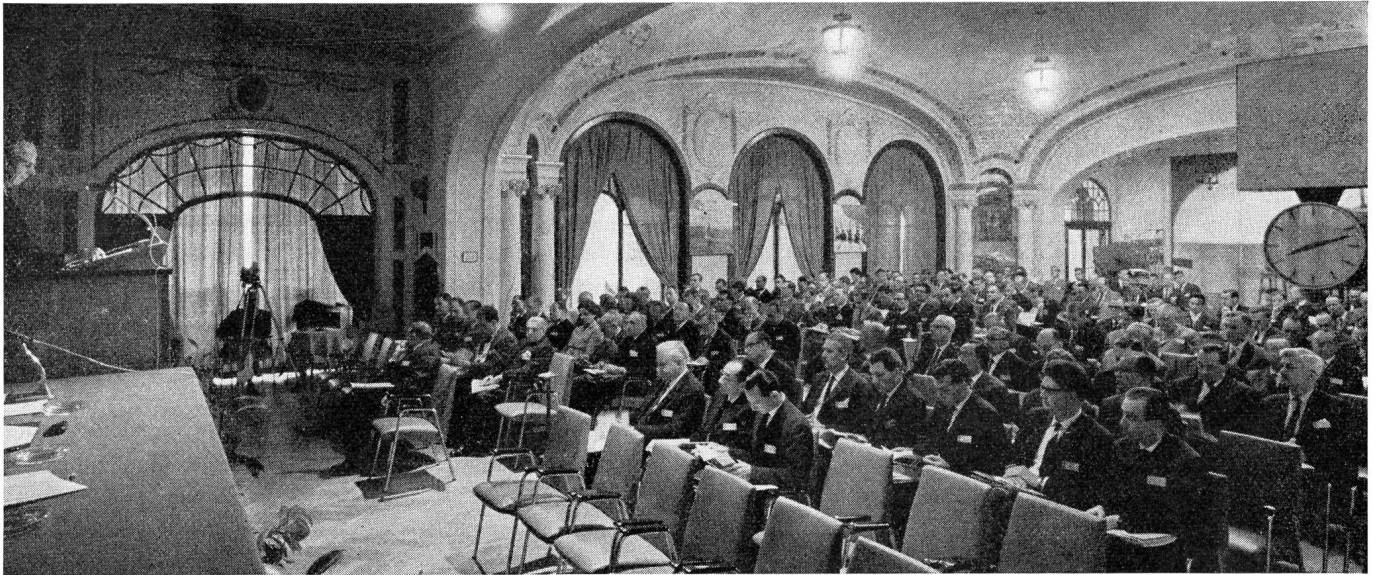
Fig. 1. Eröffnungssitzung des 3. Internationalen Fernseh-Symposiums. Am Rednerpult der Präsident der schweizerischen PTT-Betriebe, Dipl. Ing. G. A. Wettstein

Betrieb werden die beiden Fahrzeuge mit sechs Mehrfachkabeln miteinander verbunden. Als weitere Entwicklung für das Schweizer Fernsehen wurde ein kleiner Reportagewagen mit nur einer oder höchstens zwei Kameras erwähnt, der sich bei Sportübertragungen, die sich auf einem eng begrenzten Raum abspielen, bei Interviews oder als Satellit eines grossen Reportagewagens sehr gut eignet und mit einem Minimum an Bedienungspersonal auskommt. In nächster Zeit wird schliesslich noch eine weitgehend transistorisierte Anlage geschaffen, die, in Transportkisten eingebaut, leicht überall dorthin gebracht werden kann, wo die normalen Reportagezüge nicht hingelangen können. Es zeigt sich, dass der ursprüngliche Reportagewagen immer mehr spezialisiert wird: einerseits werden Wagen für studiogemässe Übertragungen geschaffen, andererseits wird die Ausrüstung immer mehr in kleine Einheiten aufgeteilt.