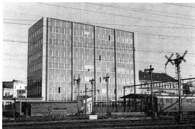
Fig. 1. Das neuerstellte PTT-Hochhaus neben der umgebauten Hauptpost in Biel, vom Bahnhofareal aus gesehen

wurden die Studien wieder aufgenommen. Auf Anregung des Stadtbaumeisters plante man ein Hochhaus. Nach verschiedenen Einsprachen und Besprechungen zwischen der Direktion der Eidgenössischen Bauten, der Hochbauabteilung der GD PTT und den PTT-Diensten, und nach der Bereinigung der Pläne wurde 1957 das Projekt von der Generaldirektion genehmigt, und in der Juni-Session 1959 bewilligten die Eidgenössischen Räte den Baukredit von 8,625 Mio Franken. Im März 1960 konnte mit den Arbeiten begonnen werden, die sich in den Hochbau (unter Leitung von Architekt W. Sommer ), den Bau des Zwischentraktes, den Umbau des alten Gebäudeteiles und der Perrons (Leitung Archi-