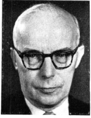
Dr. Willi Spühler

geb. 1902, Bürger von Zürich und Leukerbad (Wallis). Studium der Nationalökonomie an den Universitäten Zürich und Paris, 1925 Dr. oec. publ. Tätigkeit u. a. im Bankfach und beim Internationalen Arbeitsamt in Genf. 1931 Adjunkt des städtischen Arbeitsamtes Zürich, 1935-42 dessen Vorsteher. 1942-50 Stadtrat von Zürich, 1948-55 National- und 1955-59 Ständerat, 1959 Wahl zum Bundesrat. Seither Vorsteher des Eidgenössischen Verkehrs- und Energiewirtschaftsdepartementes.