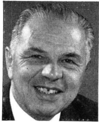
Gustav Adolf Wettstein

Born 1902, citizen of Zurich and Leukerbad (Valais). Studies in economics at universities Zurich and Paris. 1925 Dr. oec. publ. First worked in banks and at International Labour Office. 1931 assistant director, 1935-42 director of Zurich Labour Office. 1942-50 Municipal Councillor of Zurich, 1948-55 National Councillor and 1955-59 Councillor of the States. 1959 appointed Federal Councillor. Since then he has headed the Federal Department of Transport, Communications and Power.