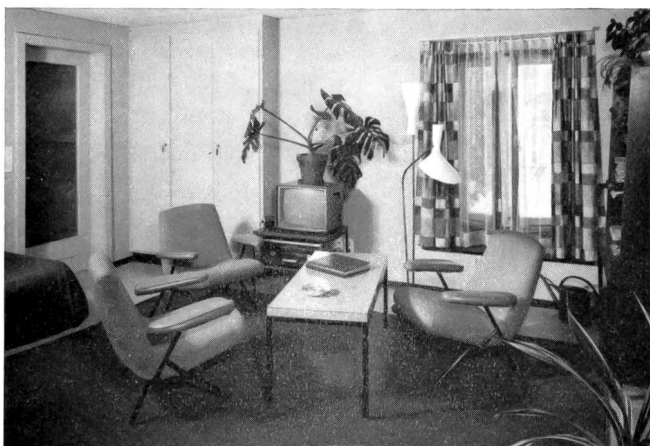
Fig. 4 Aufenthaltsraum für das Personal der Höhenstation. An den Pflanzen wird deren Verhalten in grosser Höhe und unter ungewöhnlichen Umwelteinflüssen (trockene Luft, Ozongehalt, kosmische Strahlung usw.) studiert

Bei akuten Erkrankungen können infolge der Abgeschiedenheit weitere Erschwernisse auftreten, weil der Patient unter Umständen erst nach Stunden ärztliche Hilfe erhalten kann. Um ernsthaften Fällen vorzubeugen (zum Beispiel