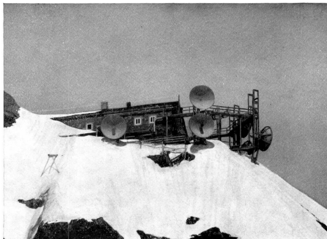
Fig. 2 Ansicht der Richtstrahlstation von Südosten

Der Entwicklungsstand der Mikrowellentechnik nach dem zweiten Weltkrieg erlaubte es bald einmal, eine Verbindungsmöglichkeit auf drahtlosem Wege über die Alpen zu suchen. Sie sollte in erster Linie der Übermittlung der Fernsehbilder dienen, da diese noch nicht über die bestehenden Koaxialkabel übertragen werden. Wegen der ganzjährigen Bahnzufahrt zum Jungfrauoch war es naheliegend, einen Übergang in dieser Region zu suchen. In der Tat konnte am Ostgrat der Jungfrau Sichtverbindung mit der Höhenstation Monte Generoso im Tessin gefunden werden. Für Mikrowellen ist optische Sicht auf jeden Fall notwendig. Mit der Richtstrahlstation Jungfrauoch haben die Stationen Monte Generoso, Albis-Felsenegg, Bantiger, Bern, Niederhorn, Chasseral, St. Chrischona sowie die Ebene Matte (Ober-