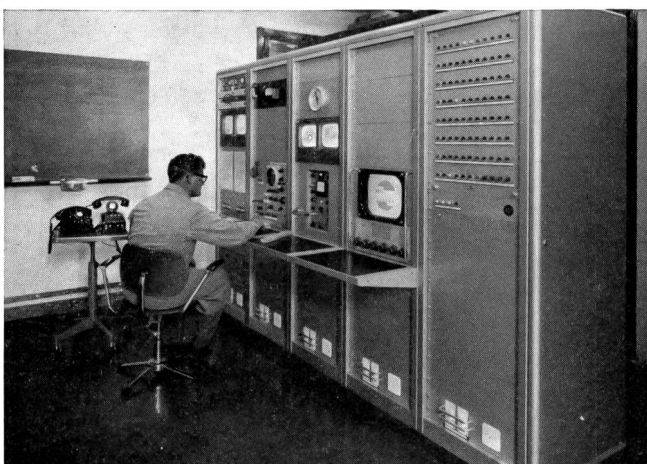
Fig. 3 Überwachungsplatz für das Fernsehen mit der Alarmbucht

Da auf einer derart hoch- und abgelegenen Station kein Mensch ständig leben kann, werden die Leute im Turnus eingesetzt. Zur Zeit sind der Fernmeldespezialist und die