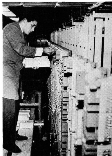
Fig. 2 Mise en service des raccordements d'abonné au nouveau répartiteur principal

Après un souper pris en commun, les participants furent invités à visiter l'ancien central où ils purent assister à l'établissement manuel des dernières communications par les téléphonistes des services spéciaux. Ils furent ensuite conduits dans le nouveau bâtiment pour être présents lors de la commutation proprement dite et des travaux nécessaires tels que coupure des jonctions entre répartiteurs, mise en service des raccordements d'abonnés sur les nouvelles bases, etc. Une visite des