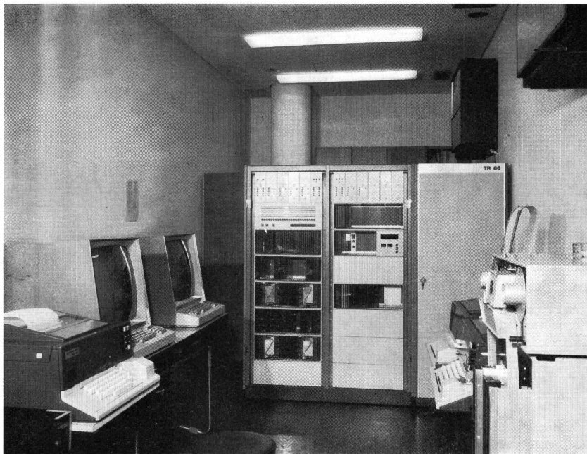
Fig. 1 Prozessrechner TR 86 von AEG-Telefunken mit (rechts) Lochstreifenleser und -stanzer sowie (links) Blattschreiber und Datensichtgeräten. Der hinter dem Rechner aufgestellte Plattenspeicher hat eine Kapazität von 16 Mio Bit

Der Prozessrechner, der in der neuen Betriebszentrale des NDR aufgestellt ist, wird zurzeit im Testbetrieb erprobt. Er wird Mitte 1972 die Programmabwicklung übernehmen. Zu diesem Zweck wird mit Hilfe einer Schreibmaschine ein Lochstreifen für den täglichen Programmablauf angefertigt und sodann dem Rechner in seine Programmspeicherung eingelesen. Danach ist er in der Lage, zu den gewünschten Zeiten die Ton- und Bildquellen einzuschalten und den Programmablauf zu übernehmen. Er startet die Film- und Magnetbandmaschinen, sucht sich die gewünschten Diapositive aus den Magazinen aus, schaltet Mikrophone und Kameras sowie die Beleuchtung in den Ansagestudios ein und auch wieder aus, und er sucht bei einer Bild- oder Tonstörung das hierfür notwen-