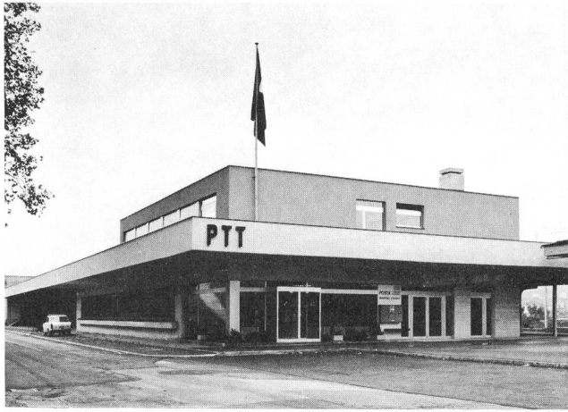
Fig. 1 Ausgedehnte Vordächer schützen die Betriebsräume einer Post vor übermässiger Sonneneinwirkung – Des avant-toits étendus protègent les locaux d'exploitation d'une poste contre les effets excessifs du rayonnement solaire

ren im Sinne von Fehlinvestitionen. Die Erfahrungen bestätigen, dass Gebäudestandort, Raumdisposition, Fassadengestaltung, Benützungsort und Gebäudetauglichkeit in enger gegenseitiger Abhängigkeit stehen. Eine die Gebäudesituation und damit die umweltbestimmenden Wirkeinflüsse vernachlässigende Fassadengestaltung kann auch bei bester künstlerischer Konzeption zum Fiasko und für den Bauherrn zu einer teuren Lehre werden.