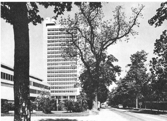
Fig. 3 Balkone, Horizontalblenden und Lamellen-Rollstoren beschatten die Fensterflächen an einem Hochhaus – Des balcons, des brises-soleil horizontaux et des stores à lamelles protègent les fenêtres d'une maison tour

Von recht guter Wirkung, und vom Aufwand her günstig, erweist sich bei zu stark erwärmten Räumen eine Nachtlüf-