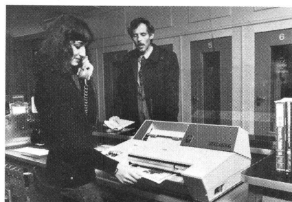
So wird ein Faxogramm gesendet

Die in den letzten Jahren mit verschiedenen Gerätetypen gesammelten Erfahrungen veranlassten die PTT-Betriebe, den Remotecopier von Plessey für den Versuchsbetrieb einzusetzen (Fig. 1). Er gestattet – zusammen mit einem automatischen Anrufbeantworter – einen bedienungsfreien Empfang, verfügt über einen getrennten Empfangsteil mit Endlospapier und einen selbsttätigen Einzug für das Original. Das Gerät entspricht den CCITT-Empfehlungen und ist mit dem verbreiteten Telecopier von Rank Xerox kompatibel. Da die für den Versuch verwendeten Apparate nur gemietet sind, wobei Unterhalt und Wartung durch die Lieferfirma besorgt werden, ist die Gerätewahl für einen allfälligen späteren, endgültigen Betrieb noch in keiner Weise präjudiziert. Dies ist im Blick auf erscheinende Einrichtungen der neuen Generation, auf Digitalbasis arbeitend, besonders wichtig.